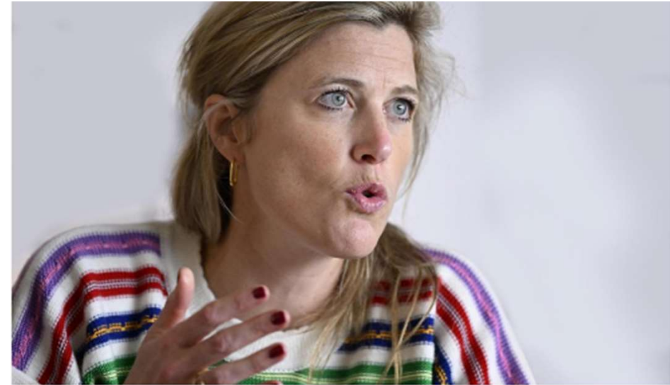
Minister Annelies Verlinden.