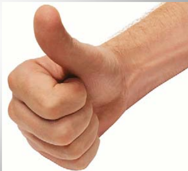
er zijn belangrijke pluspunten aan wet 7/11/11