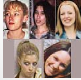
drie lichamen bruikbaar DNA