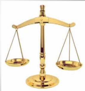
balans terug in horizontale richting ?