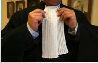
SALDUZ = belemmering van de opsporing