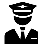
Douane & Accijnzen