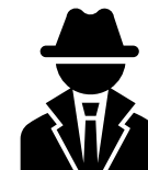
Gem. dienst bevolking