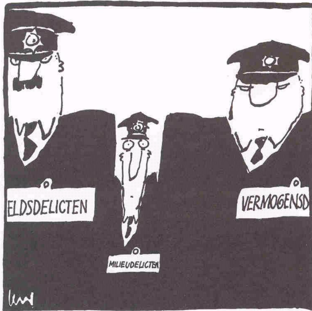
(Len Munnik, illustrator)