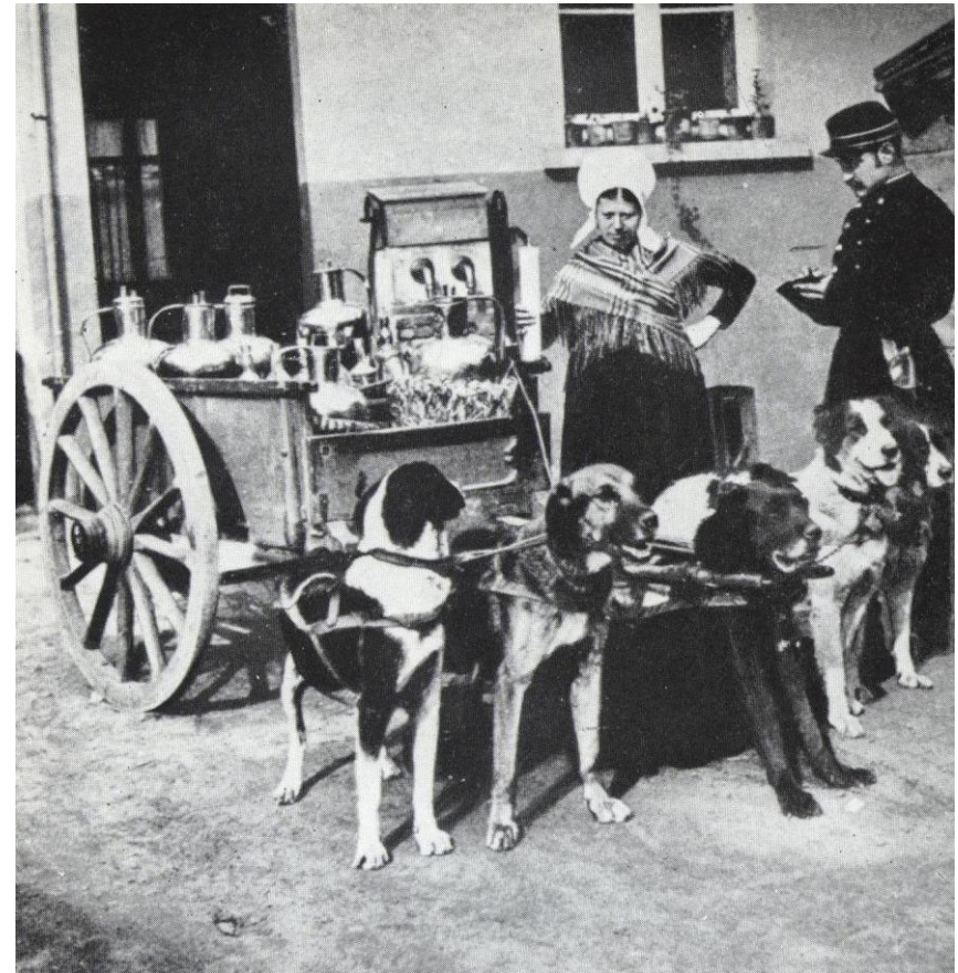
1895 – politie beboet melkverkoopster